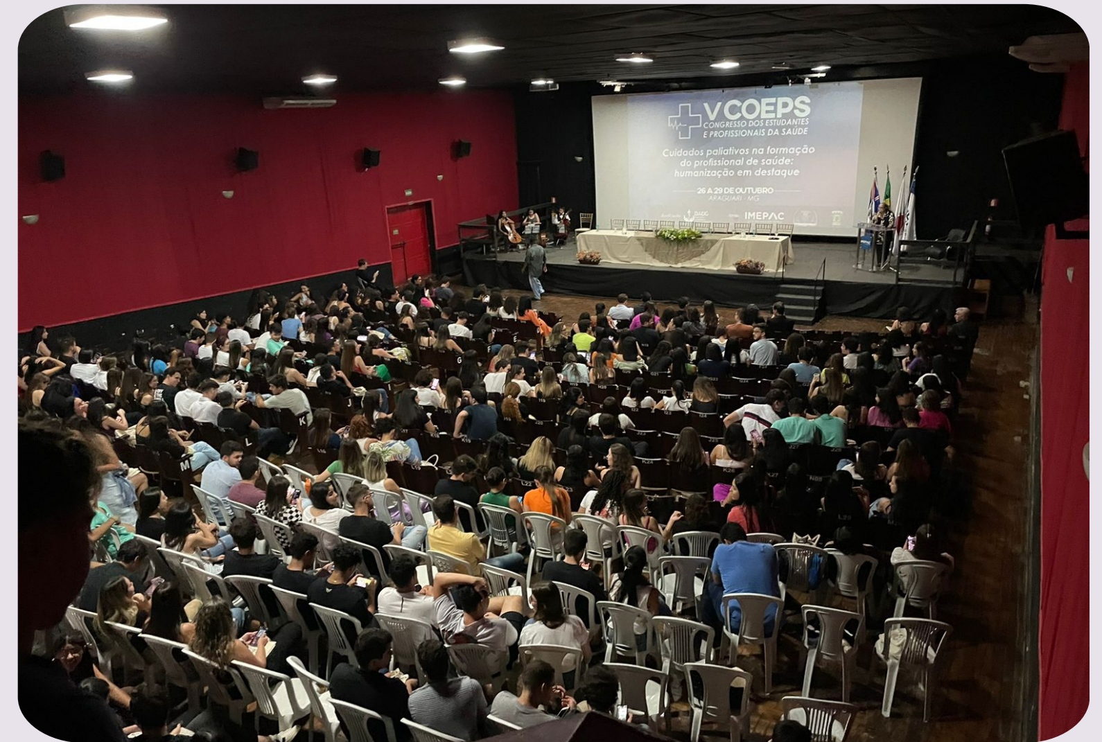
Cine Teatro Odette Araguari - MG.

Portanto, trata-se de uma região promissora para a realização de projetos como o aqui proposto.