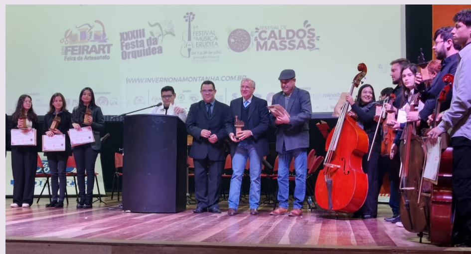
Primeiro Festival de Música Erudita de Santo Antônio do Pinhal- 2º Lugar