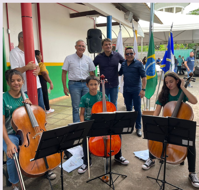
Prefeito e Secretário de Ação social no Cejusc-Mutirão social em Araguari