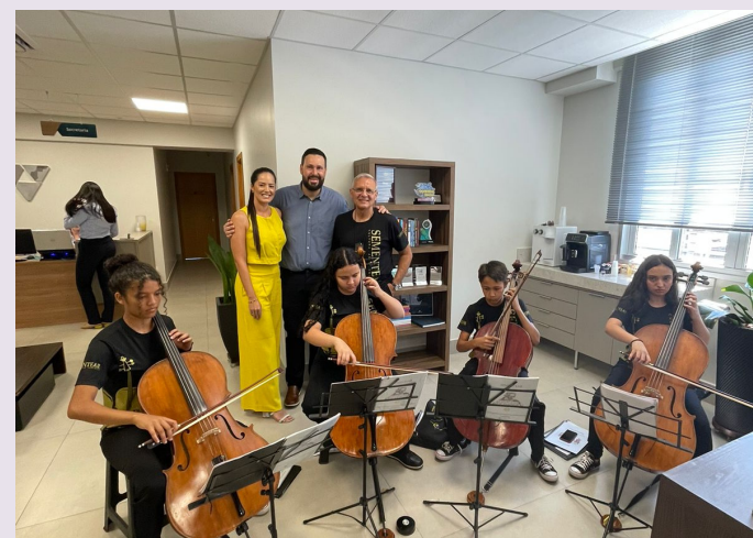
Deputado Estadual Raul Belém na inauguração da Universidade Estadual de Minas Gerais