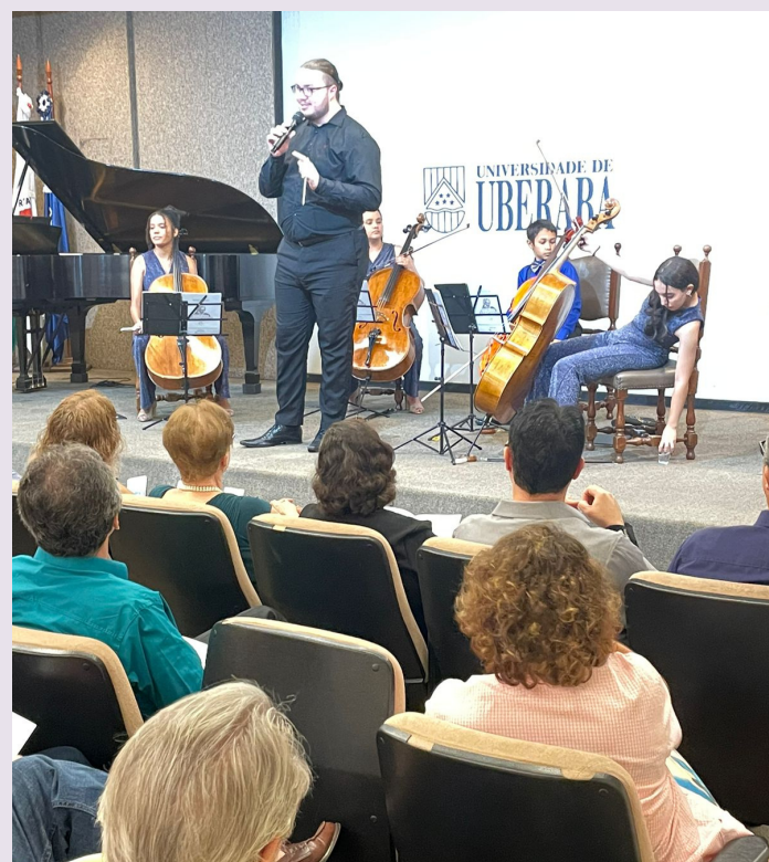
Apresentação na Universidade de Uberaba, sala Cecília Palmério