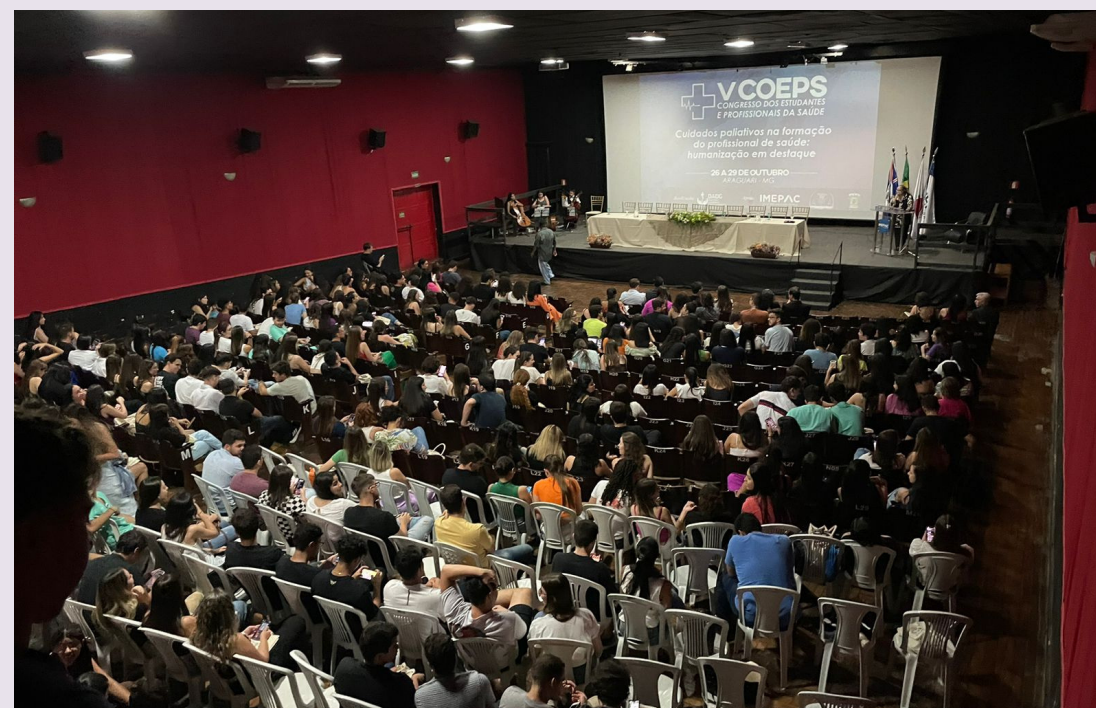
V Coeps da Faculdade de Medicina Imepac