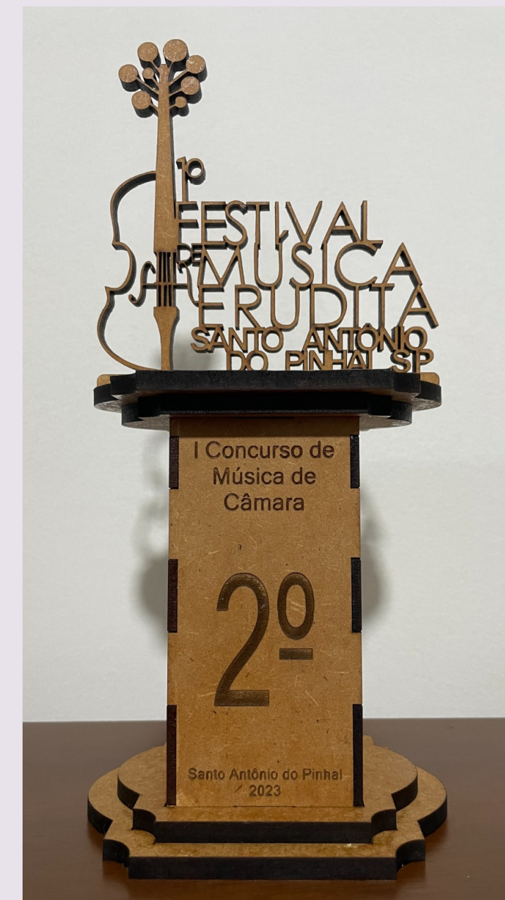
Troféu de 2º lugar do primeiro Festival de Música Erudita de Santo Antônio do Pinhal