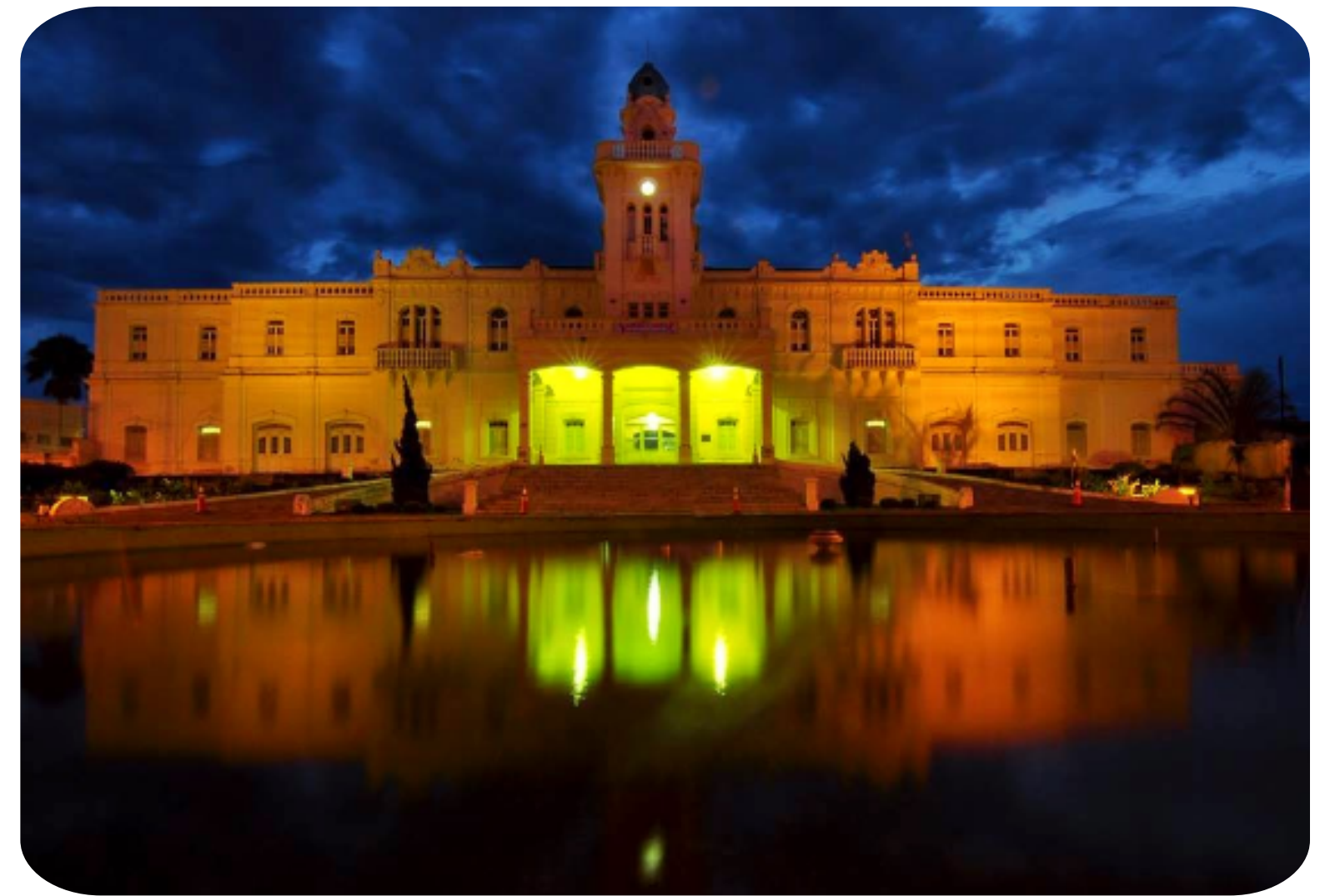
Palácio dos Ferrovários Araguari MG

No que diz respeito à cultura musical, a cidade possui tradição, pois abriga o Conservatório Estadual de Música, cinquentenário, além de possuir uma relação íntima com Uberlândia, onde é oferecido o curso de graduação em música pela Universidade Federal.